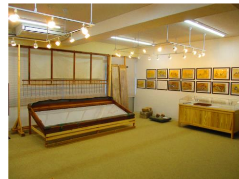
1階ラウンジ横の展示コーナー（無料） 皇居宮殿の特注障子をすいた桁と馬鍬。