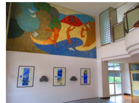
学校時代の面影を残す玄関ホール