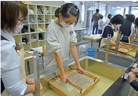
児童は「 すけた 箕桁がちょっと重かった。でも完成が楽しみ」と笑顔で話しました。

年度末に小中学校を卒業する児童生徒が、卒業証書となる和紙を、自らの手ですく作業を美濃和紙の里会館で行いました。 美濃市では、平成13年度から伝統産業である美濃和紙への理解を深めようと、市内の全小中学校で自分のすいた和紙を卒業証書としています。 この日は、中有知小学校6年生44名が、同会館職員の手ほどきを受けながら、和紙の原料を箕桁とよばれる木の枠ですくい、前後左右に揺らしながらすく「流しすき」と呼ばれる技法で和紙をすきました。 その後、和紙の中央に校章をかたどった薄い和紙を置き、その上に別で用意された薄い和紙を重ね合わせ、校章の透かしが入った厚みのある卒業証書を完成させました。