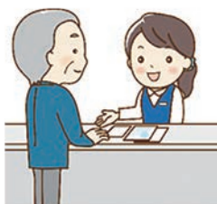
第三者がAさんの住民票などを取得すると…