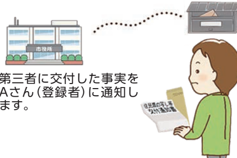
第三者に交付した事実をAさん(登録者)に通知します。

◆通知の対象となる場合/登録者の住民票の写し(戸籍の表示が記載されているものに限る)や戸籍謄抄本などを本人以外の第三者(委任状を持った代理人も含む)へ交付した場合