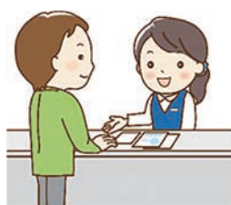
Aさんが本人通知制度の事前登録を行います。