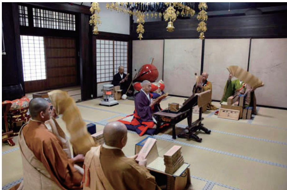
善月祈祷大般若会