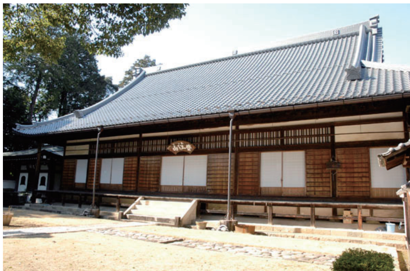
金森家、佐藤家の位牌を祀る清泰寺本堂

本堂は、明和4年(1767)の再建とされ、桁行7間、梁間13間の入母屋造で、奥に開山堂を付す大規模な本格的禅宗建築である。堂内には、保寧寺殿(佐藤清信)、以安寺殿(佐藤秀方)、岩佐院殿(佐藤方政)、清泰寺殿(金森長近)、繡雲殿(金森長光)、久昌院殿(長光母)の佐藤家、金森家の各位牌が祀られている。また、本堂裏には佐藤清信、秀方の墓、金森長光(長近の二男)の墓があり、文政4年(1821)には佐藤一斎が先祖を偲びこの墓に詣でている。長光の墓は、もとは三門を入った左手奥の長近の霊を祀る金森大権現社に祀られていたもので、明治の神仏分離で墓地へと移された。金森大権現社は江戸時代には拝殿、本殿の規模も大きく参道も南面にあり、参拝者も多かった。かつて3月12日には祭礼があり、安政4年(1857)には小倉山城主当巳二百五十年祭が行われ盛大な供養がされるなど、長近は上有知の人々に崇敬されていた。