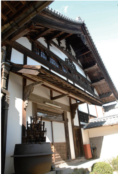
優美な妻飾りを掲げる清泰寺庫裏

参道から三門を通ると、築地塀に囲まれた寺内に入る。正面には禅宗建築独特の庫裏が威風堂々と建ち、見る者を圧倒する。天保年間（1830 - 1844）の改築とされ（『清泰寺由緒書』）、大妻を正面に向け唐草くずしと波の彫刻をもつ妻飾りが優美さを増している。