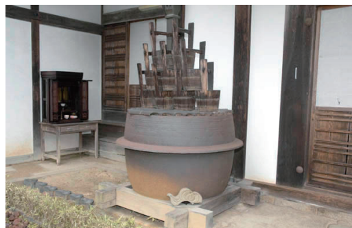
大正時代に紙漉き職人により寄贈された楮を煮る煮熟釜が、庫裏の玄関前に置かれている。