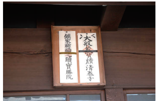
毎年1月に配られる大般若祈祷札は、檀家の家の軒先に掲げられる。