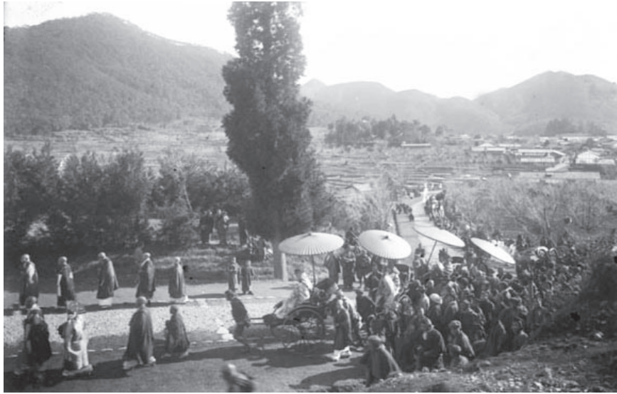
明治30年代、上有知の町から郡上街道を通り、 曾代地区へ向かう清泰寺の年頭参り

ると住職は人力車にのり、上有知の町から打上坂（有知上坂）を上り曾代へと向かった。上有知の人々は共に練り歩き新年を祝った。