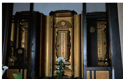
本堂に祀られる清泰寺殿、保寧寺殿、以安寺殿の位牌

清泰寺では毎年正月元旦から3日には修正会、1月、5月、9月の各15日には善月祈祷大般若会、昭和34年(1959)からは同日に壇信徒の女性のみで組織された「和敬会」の会合が執り行われ、当