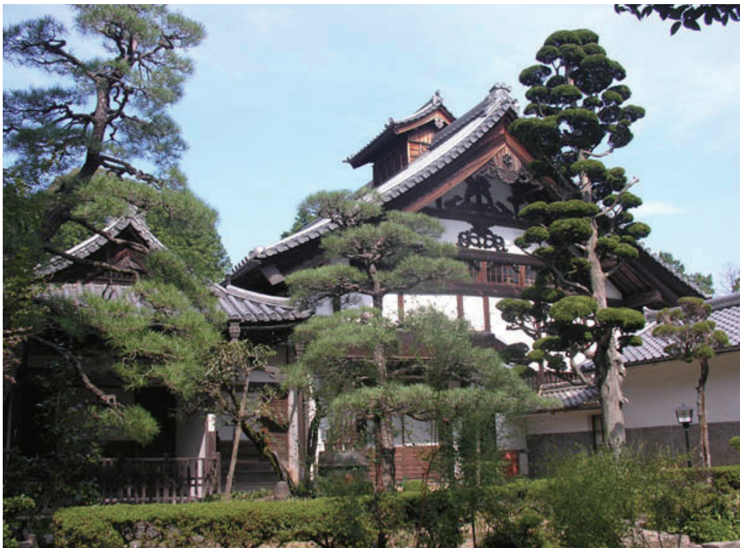
天保年間に改築された壮麗な建築様式をもつ清泰寺庫裏