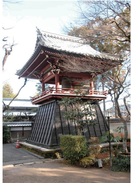
400年間、うだつの上がる町並みに梵鐘の音を伝える清泰寺鐘楼

江戸時代には、正月に、城下町の年頭廻りが行われていた。住職は駕籠に乗り全山僧侶を従えて、若党2名が先頭の露払いに立ち、「清泰寺、年頭」と大声で呼び、各町内を練り歩いた。その駕籠は現在本堂の天井に吊るされている。また、明治時代に入