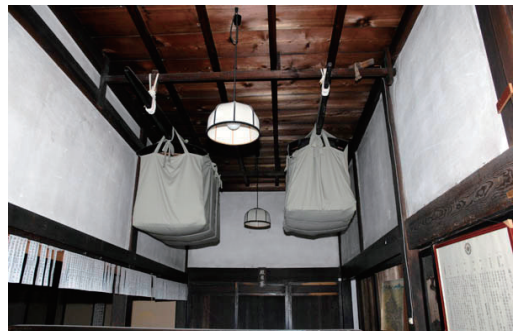
本堂の天井には、江戸時代年頭参りに使われた駕籠が保管されている。

金森家菩提寺である清泰寺は、うだつの上がる町並みの繁栄と牧谷の紙漉き職人の繁栄を願った。多くの檀家により活動は支えられ、城下町時代の風習は今も続けられ、檀家の家屋の軒先には清泰寺のお札が掲げられる。また、牧谷の紙漉き職人も400年間金森長近への恩を忘れず、毎年長近へ感謝を捧げている。牧谷と上有知、職人と商人、各々の立場は違うが、ともに美濃紙の繁栄と安泰を願った。清泰寺では今も風情ある佇まいを残し、牧谷の人々、上有知の人々を見守っている。