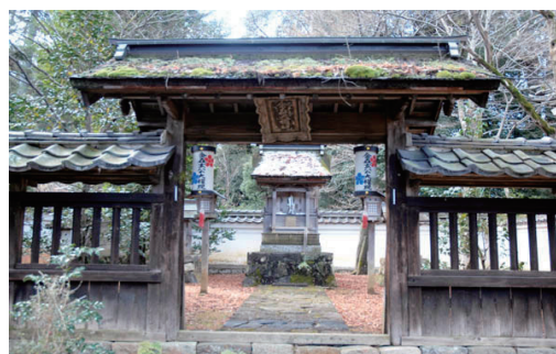
三門を入り南脇に建つ金森大権現社