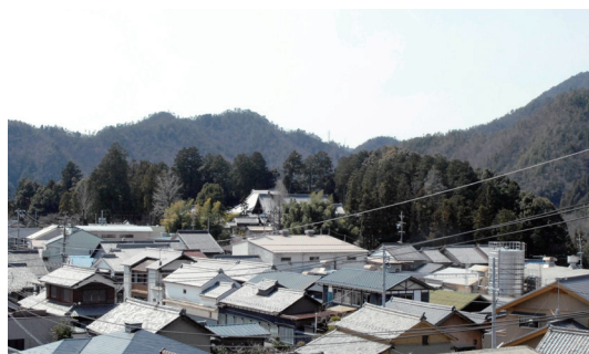
うだつの上がる町並みから隔絶した清泰寺

清泰寺は臨済宗本山妙心寺の直末寺、妙心寺派の寺班特例地とされている。慶長10年（1605）金森長近は前領主佐藤秀方の菩提寺であった以安寺を移築し、妙心寺派僧鉄松和尚を開山として、「安住山清泰寺」と改称し、金森家菩提寺とした。清泰寺前には当時総門があったとされるが、今はない。