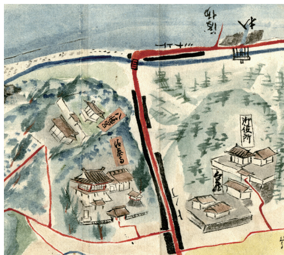
寛政4年（1792）武儀郡上有知村絵圖に描かれる、清泰寺、八幡神社及び尾張藩上有知代官所