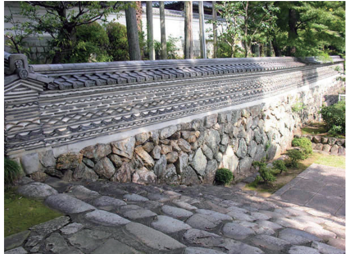
城下町時代の野面積みの石垣が残る築地塀