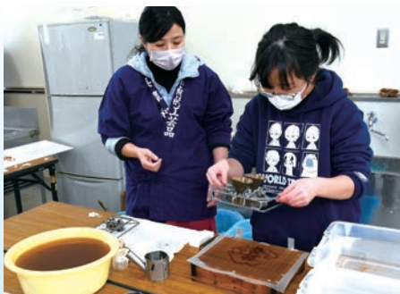
児童は「慎重な作業ばかりだったけど出来上がりが楽しみ。」と話していました。

牧谷小学校で6年生児童21人が、自分たちの卒業証書となる和紙を漉きました。 同校では例年、6年間美濃和紙について学んだ集大成として校内にある紙漉き教室で卒業証書を漉いています。 この日、美濃手漉き和紙協同組合の紙漉き職人6人の指導のもと、児童たちは証書作りに挑戦。金属の型に繊維を混ぜた茶色い溶液を流し込んで「校章」を製作した後、「流し漉き」の技法で和紙を漉いて証書を作り上げました。 また、今年からは東京オリピック・パラリンピックの表彰状でも使われた「すかし」の技術が用いられているため、完成した証書をよく見ると「MAKIDANI」という透かし文字が浮かび上がる卒業証書となっています。