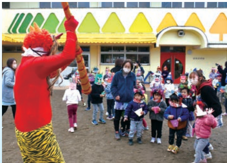
鬼に向かって一生懸命豆まきをする園児たち。

松美保育園で、全園児98人による節分の豆まきが行われました。 これは、同園が節分の日に合わせて行っている毎年の恒例行事で、園児たちはこの日のために、毛糸や画用紙などを使って鬼のお面とマスを製作しました。 園児たちは、豆まきが始まると、金棒を持って追いかけてくる鬼から逃げたり、怖くて泣いたりしながらも、マスに入った豆を「鬼は外、福は内」と言いながら鬼に向かって必死に投げ、撃退しました。 豆まきをした園児は、「鬼は怖かったけど泣かずに豆を投げれた。」と話していました。