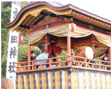
楽車の上で獅子舞が行われている。楽車は古い時代の特徴を備えている。

現在大矢田神社では、祭神は素戔嗚尊と天稚彦命となっております。牛頭天王との関係については後日機会を設けて述べてみたいと思つています。