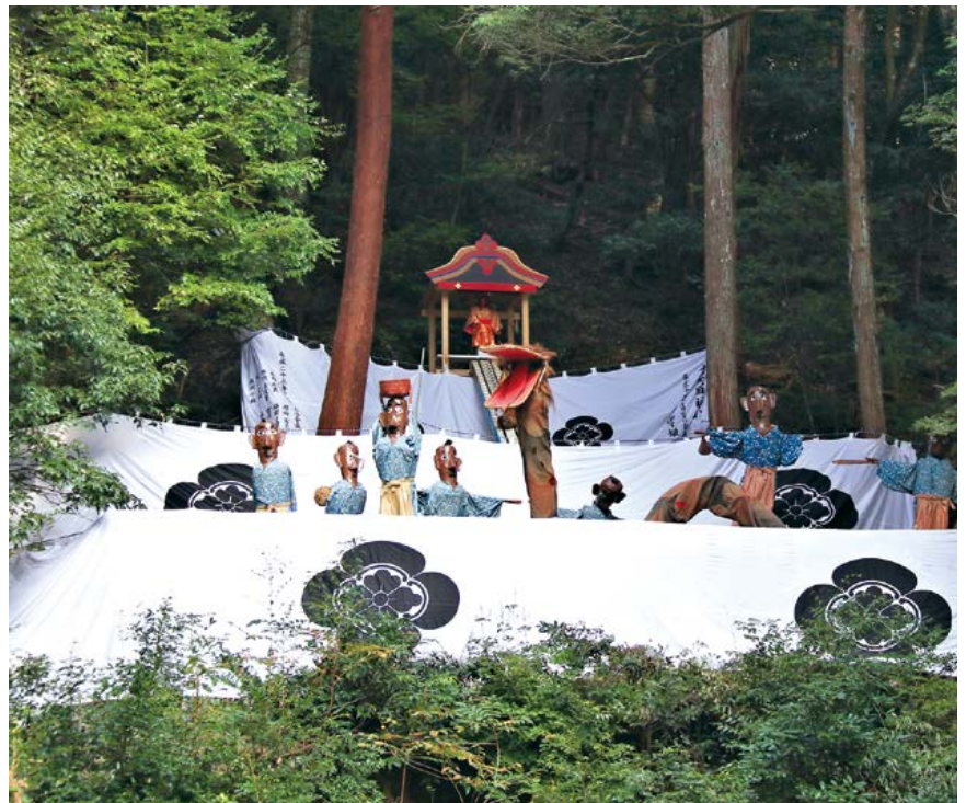
山の舞台は三段から成り立っている。下の段では麦まき神事が行われる。この場面は大蛇が農民をのみ込もうとしている。上の段に屋形があり、猩々姫がいる。頭の髪から、顔及び衣装すべて朱紅色にまとめられた姫と、二段から滝を昇り降りする竜はカラクリ人形である。観客はこれらの芸能を下の祭礼場から仰いで鑑賞することになっている。幕に付いている神社の紋所は木瓜(もっこう)であるが、祇園社や津島天王社のもとは少し違い、大矢田神社独自の紋である。