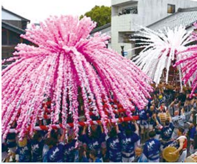
▲色鮮やかな花みこしが乱舞した総練りの様子

初日は、大小の花みこし15基が「オイサー、オイサー」の掛け声や太鼓の音を響かせながら町並みを練り歩きました。夜には、13町内の有志による「美濃流し仁輪加」が目字通りの4力所で上演されました。2日目には、山車や練り物の奉納が八幡神社で行われ、見物客を楽しませていました。