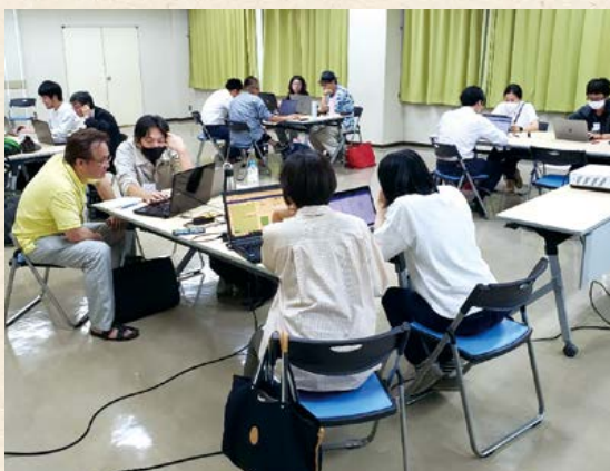
▲地域おこし協力隊による取り組み