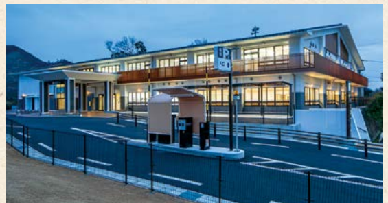
▲健康文化交流センター