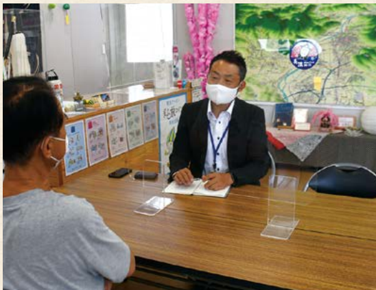
▲地域活性化起業人による取り組み