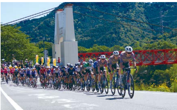
4年ぶりにツアー・オブ・ジャパン美濃ステージが開催されました。