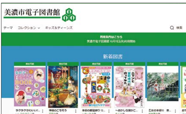
電子図書館サービスを開始しました。