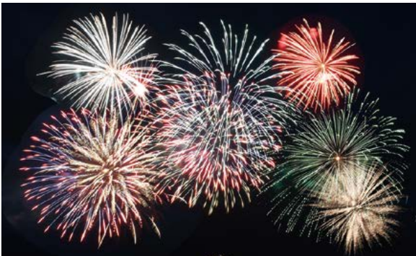
第1回美濃市民花火大会が開催されました。