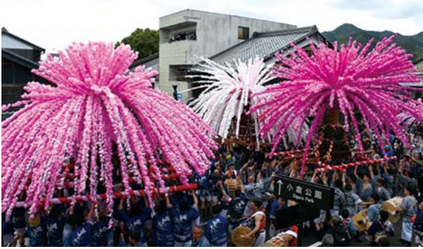
4年ぶりに美濃まつりが開催されました。