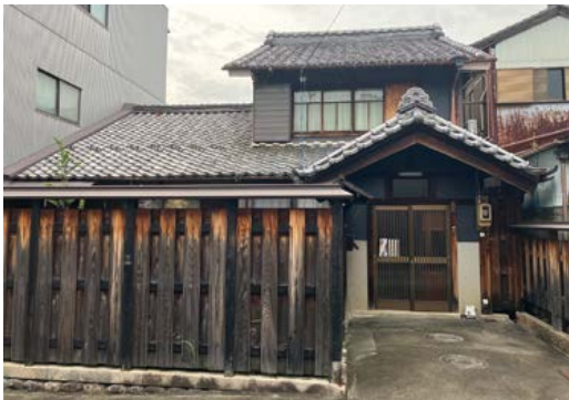
まだ名はない古民家(仮)

人工林は人が手入れを行うことを前提に木が植えられており、放置してしまうと森林の環境が悪化してしまいます（次回以降詳しくご説明いたします）。そうはいっても、「山を持っているがどうしたらいいかわからない」という方も多いのではないのでしょうか。何を相談したら良いかも分からないという気持ちでも大丈夫です。ぜひお気軽にお越しください。