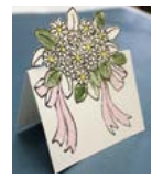
和紙クラフトカード