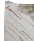
色紙(しきし)アート